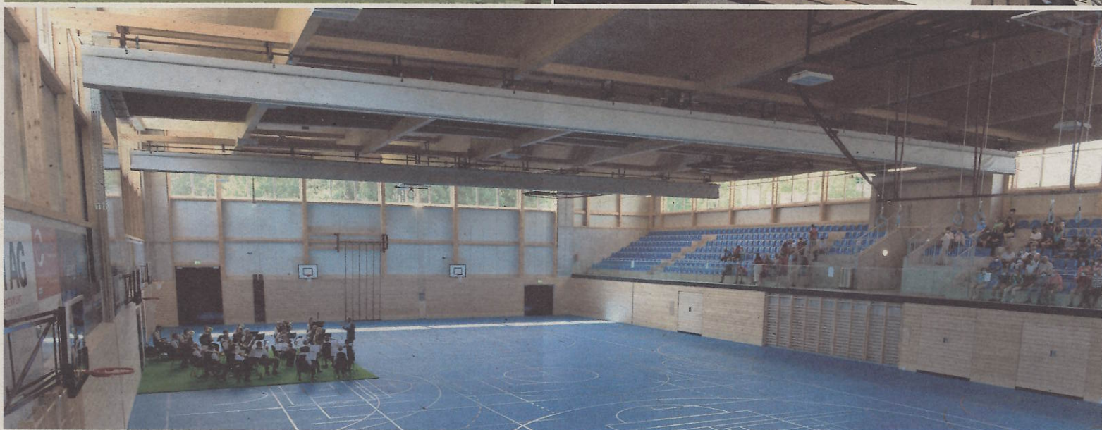
Die Einweihung der neuen multifunktionalen Sporthalle wurde vom Musikverein Gossau musikalisch umrahmt.